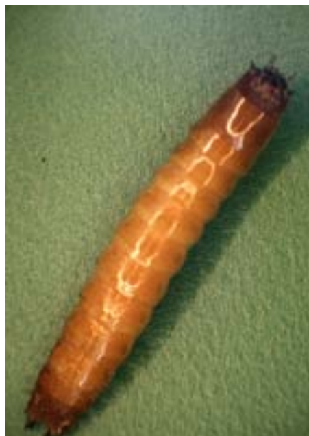
Ritnaalden (ruim 20 mm lang) komen vooral voor op gescheurd grasland.

Wortels van jonge planten worden door ritnaalden, ook wel koperworm genoemd, bij het hypocotyl doorgebeten. De wortel wordt rondom aangevreten door de ritnaald. Ritnaalden komen vooral voor op gescheurd grasland in het tweede jaar na het scheuren. Er kan een redelijke bestrijding worden verkregen door speciaal pillenzaad. Na opkomst zijn er geen bestrijdingsmogelijkheden. Bij verwachte schade kunt u eventueel nauwer zaaien. Door een halve aardappel 20 cm in de grond in te graven en twee weken later weer op te graven, krijgt u inzicht of u schade kunt verwachten.