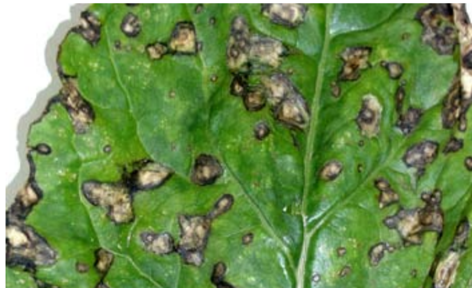
Bacterie pseudomonas is niet te bestrijden.

In de loop van het seizoen komen, vaak na zware regen- of hagelbuien, nog andere bladziekten voor, zoals de schimmel alternaria en de bacterie pseudomonas. Bestrijding daarvan is niet mogelijk.