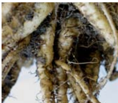
Bietenwortel vol met bietencysteaaltjes.

Wortellesieaaltjes ( Pratylenchus spp. ) zijn op lichte grond wijd verspreid, maar veroorzaken geen schade aan de bieten. Bieten vermeerderen dit aaltje echter wel, maar zijn het minst vermeerderend gewas in de rotatie. Gele mosterd en vooral bladrammenas geven een vrij sterke vermeerdering. De inzet van de granulaten is niet rendabel.