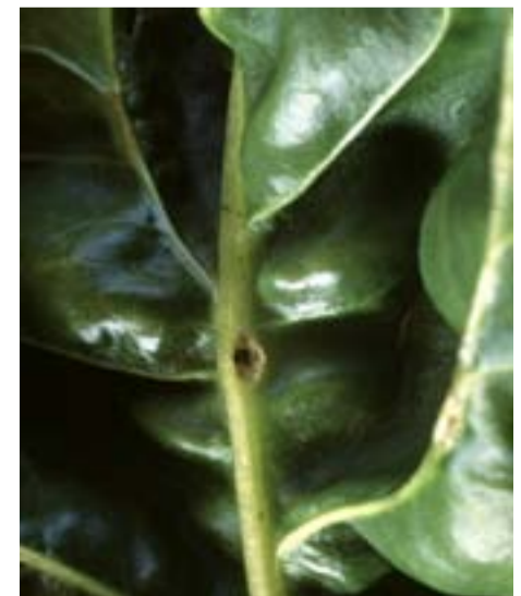
Schade door wantsen.

In de buurt van bomen, bijvoorbeeld achter windsingels, komt soms schade door wantsen voor. Deze schade kenmerkt zich door misvorming van de bladeren en soms door geelverkleuring van de bladuutenden. Op de onderzijde is op de hoofdnerf een zwart streepje zichtbaar in de lengterichting. Speciaal pillenzaad geeft voldoende bescherming.