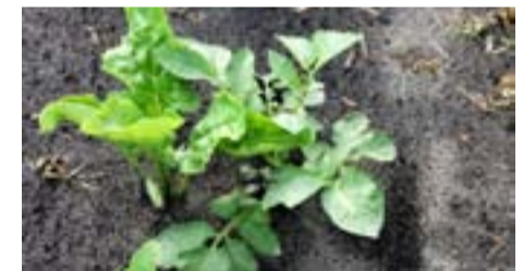
Bestrijd aardappelopslag met glyfosaat.

Voor de bestrijding van aardappelopslag is alleen glyfosaat afdoende, toegepast met speciale apparatuur (zie voor een overzicht www.irs.nl/pagina.asp?p=58 ). Bij een lichte bezetting kunt u met handapparatuur een bestrijding uitvoeren. Bij een zware bezetting kan dit gebeuren door onkruidstrijkers of door kappenspuiten. Voor een overzicht waar welke apparatuur beschikbaar is; zie www.irs.nl/pagina.asp?p=1523 .