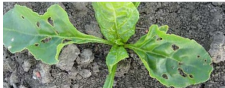
Plant met diverse venstertjes en gaatjes door aardvlooiën.

Aardvlooiën komen vooral voor op zand- en dalgronden. Bij droog, schraal weer verschijnen ze plotseling en veroorzaken dan meestal lichte schade aan kiemplanten en jonge bietenplantjes. Bestrijden is slechts incidenteel noodzakelijk. Naast speciaal pillenzaad zijn geen andere bestrijdingsmiddelen toegelaten.