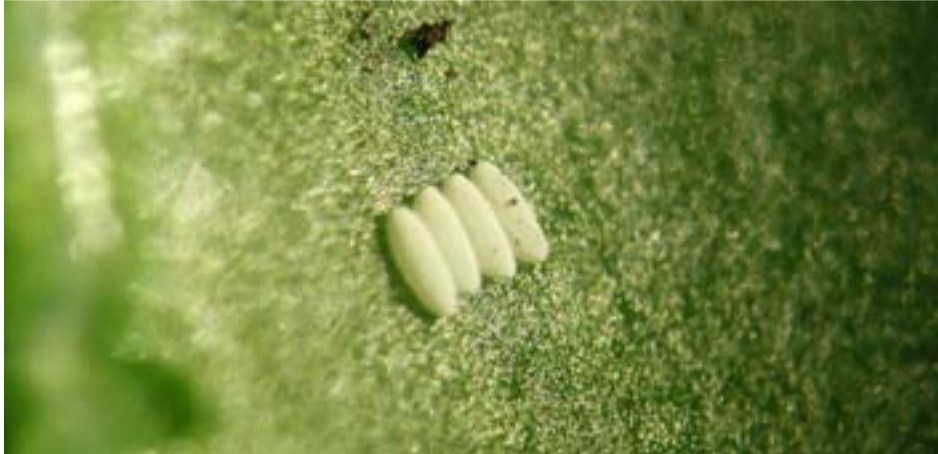
Eieren van de bietenfliet.

De bietenfliet komt op alle grondsoorten voor. Het optreden per gebied en per perceel is vaak sterk verschillend. Meestal wordt weinig schade veroorzaakt, omdat bieten een belangrijk deel van het bladoppervlak kunnen missen. Een gewasbespuiting is alleen rendabel bij jonge bietenplanten wanneer de eerste mineergangen én gemiddeld de in de tabel vermelde aantallen gevulde eieren en/of larven per plant aanwezig zijn. De bietenfliet legt cilindervormige eitjes op de onderzijde van de bladeren. Gevulde eieren vertonen een rasterstructuur en lege eieren vertonen een deukje. De larven die uit de eitjes komen, maken mineergangen tussen de oppervlakken van de bladeren. De bestrijding kan uitgevoerd worden met dimethoaat (0,25 l/ha, maximaal één toepassing per jaar). Wanneer speciaal pillenzaad is uitgezaaid, is een bespuiting niet nodig.