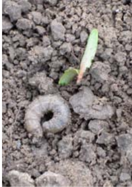
Schade door emelten.

Emelten veroorzaken vrachtschade aan kiemplanten. Speciaal pillenzaad geeft geen bescherming. In 2008 heeft Talstar 8SC (1 l/ha) een tijdelijke vrijstelling gehad. Voor 2009 is het nog onduidelijk of er een tijdelijke vrijstelling komt. Als deze er weer komt, zal er een nieuwsbericht worden geplaatst op www.irs.nl . Lees voor het kopen het gebruiksvorschrift. De aanwezigheid van emelten kunt u controleren door in de herfst stukjes zoden in een pekelbad te leggen (1 kg zout in 5 liter water). Bij 100 of meer emelten per vierkante meter in de herfst kunt u beter geen bieten zaaien.