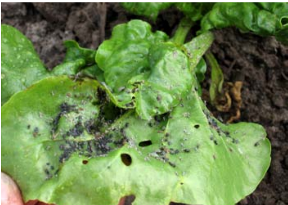
Het blad zit vol met zwarte bonenluizen.