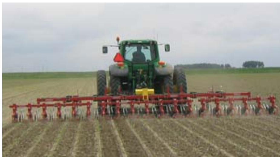
Onkruiden tussen de rijen kunt u door schoffelen goed bestrijden.

Bij veel onkruidzaad in de grond kan een mechanische bestrijding leiden tot een sterke late opkomst van onkruid door het in een betere positie brengen van onkruidzaden. Dit kan tot gevolg hebben dat er laat nog een chemische bestrijding uitgevoerd moet worden. Anderzijds kunnen door een schoffel- of anaardbewerking onkruiden die ontsnapt zijn bij de chemische bestrijding, kort voor het sluiten van het gewas bestreden worden.