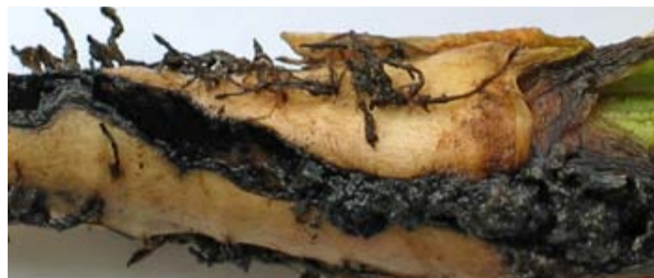
Schadebeeld van aardappelstengelboorder.

Het voorkomen van schade door de aardappelstengelboorder door het maaien van slootkanten is niet effectief, omdat de eieren aan de basis van de stengels van riet en gras worden afgezet. Zodra er aantasting is, vanaf circa half mei, op het aangetaste perceelsdeel Somicidin Super (0,45 l/ha, maximaal twee toepassingen per jaar) toepassen.